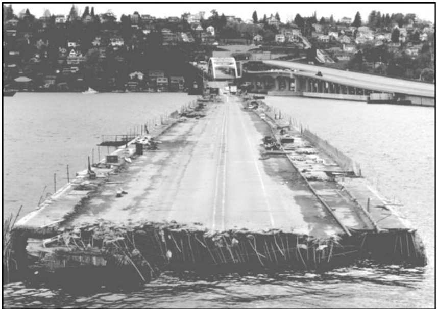
Rysunek 8.1. Część pływającego mostu na drodze I-90 w Seattle zatonała w trakcie burzy, ponieważ nie zamknięto pływaków, które utrzymywały go na powierzchni wody. Deszcz zalał je i most stał się zbyt ciężki. W trakcie budowy oprogramowania zabezpieczanie się przed drobiazgami ma większe znaczenie niż się wydaje.

Jak ilustruje to rysunek 8.1, zabezpieczanie się przed pozornie drobnymi problemami może być w rzeczywistości istotniejsze, niż się początkowo wydaje. W dalszej części tego rozdziału opiszę różne techniki sprawdzania danych ze źródeł wewnętrznych, weryfikowania parametrów wejściowych i obsługi niepoprawnych wartości.